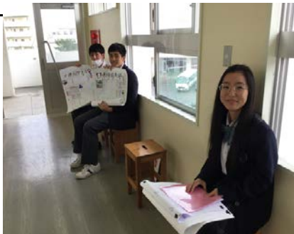
左:自分の出番を緊張して待つ3年生

当日は、3年生が各自で作成した合格体験新聞を各クラスに持ち込んで後輩の前でアドバイスや苦労したことなどを直接講義し、下級生の質疑にも答えていました。本校の近年の進路決定率はこのような取り組みの成果が現れて、H26は93%、H27は91%で本年度も2月14日現在、87%の高率を維持しています。これも1年次からの系統的、継続的な指導の結果だと自負しております。進路指導部の先生方をはじめ全職員が一丸となって生徒たちの出口指導に頑張っています。校長が言うのも何ですが、このような学校は県内、どこを探してもないのではないのでしょうか?今後とも前原高校は、生徒のニーズに応えられる進路指導を目指して取り組んでいきます。