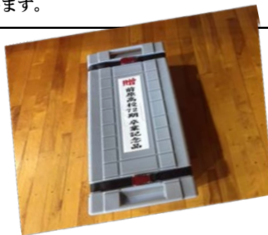
映像も大きくしっかり映りました! 右はパッケージに収納したスクリーンです! かなりコンパクトです!