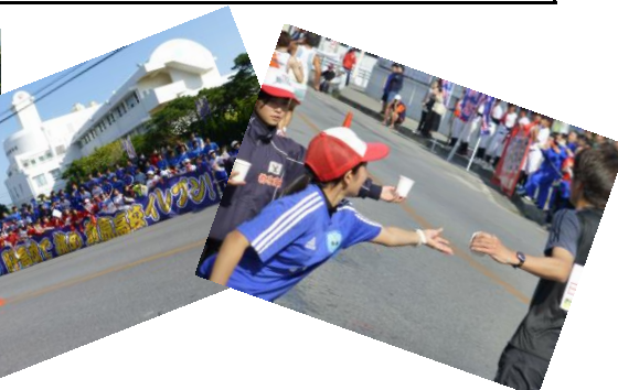
前高前のバス停に仮設の給水所を設置 正門前は応援スタンド 笑顔のマネージャからの給水