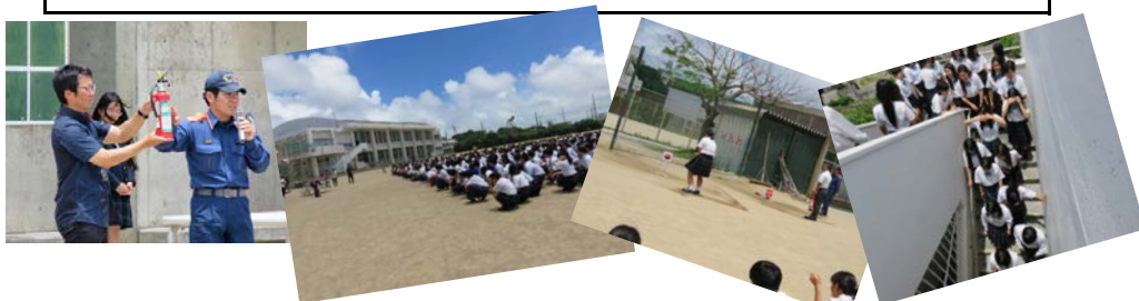
全校生徒が避難経路を確認し、運動場に避難、実際に消火器の実演をしました。

また、今回の防災訓練は、「火災を中心とした訓練」を実施しましたが、2学期以降には、「地震発生を想定した防災訓練」を予定しております。