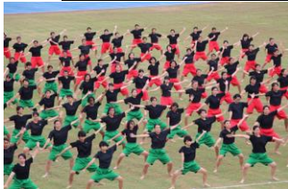
迫力の演技、感動の体育祭

最後になりますが、2年間、私にとって夢のような時間を過ごさせていただきました。全ての数字が向上しています。最終の進路決定率が94.1% (県内普通高校2位)、国公立現役合格者が久々の2桁、11名。頑張ってくれた生徒と教職員の全てに感謝しつつ前原高校を去りたいと思います。ありがとうございました！