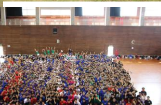
行事の時の団結力と圧倒的な盛り上がり