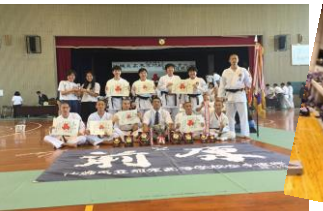
高校総体での各部の活躍と熱狂的な応援団