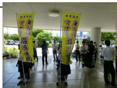
昼食時間に生徒が教室を回ってマナーUPの呼びかけをしている様子