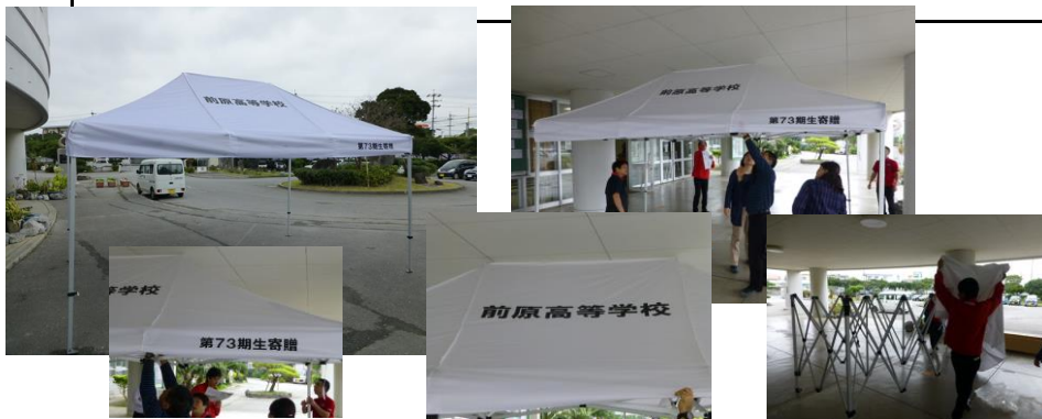
コンパクトで軽い素晴らしいテントが届きました。早速職員で組み立てて確認しました。ありがとうございます!

また、これまで運動場で行事をする際には屋外設置のスピーカーに配線を繋げるなどマイクの準備に時間を要していましたが、今回3年生から自立型移動式スピーカーも併せて贈呈されますので行事の際の視聴覚関係機材の設置が簡素化されることで職員生徒一同大変喜んでおります。3年生の後輩への心温まる卒業記念品を大切に使用してもらい、これまで以上に学校行事を盛んにし、魅力ある学校作りに努めて参りたいと職員生徒一同、心に誓ったところであります。3年生の生徒保護者の皆様にも心より感謝申し上げます。